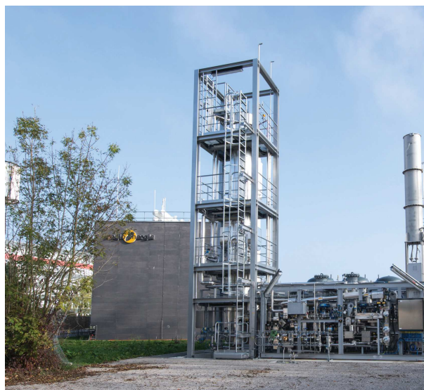
Usine hybride Aarmatt

Prière de renvoyer le formulaire d'ici le 30 novembre 2019